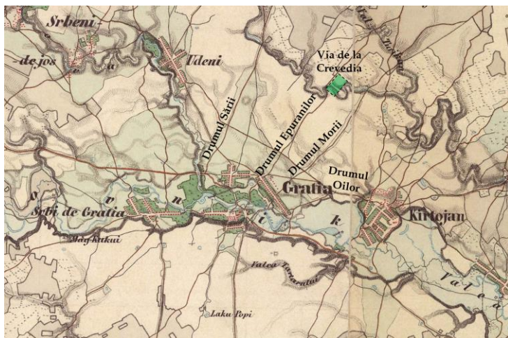
Grăția și drumurile sale în secolul al XIX-lea. Hartă adaptată după a doua ridicare topografică a Imperiului Habsburgic (1806-1869).